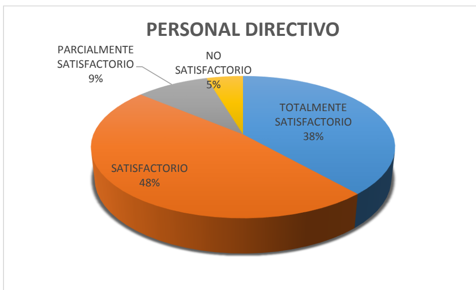
Grafica No. 1

Los resultados de evaluación de la gestión del nivel directivo con base en la gráfica No. 1 es que 25 de los Directivos tuvieron evaluación totalmente satisfactoria, el 48% del personal del mismo nivel alcanzaron una evaluación final satisfactoria y tan solo el 9% equivalente a 6 directivos su resultado fue parcialmente satisfactoria, lo que amerita plan de mejoramiento en su gestión para la próxima vigencia, por ultimo 3 directivos NO superaron la evaluación de la gestión, los cuales son sujetos a toma de decisiones por parte de la Rectoría.