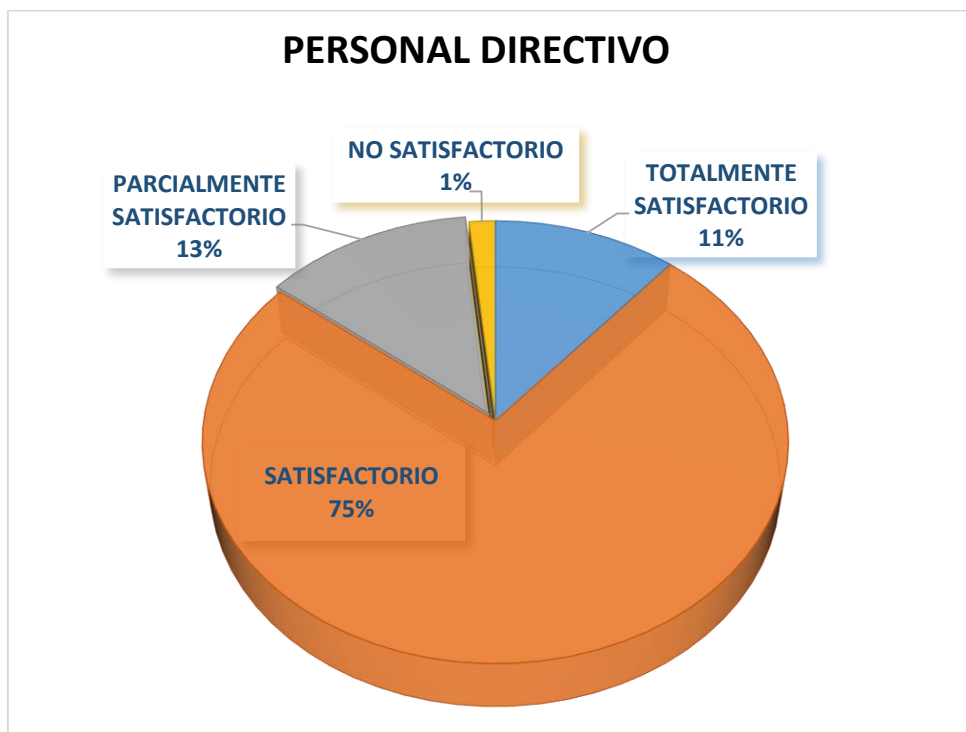
Grafica No. 1

Los resultados de evaluación de la gestión del nivel directivo con base en la gráfica No. 1 es que 7 de los Directivos tuvieron una evaluación totalmente satisfactoria, el 75% del personal del mismo nivel alcanzaron una evaluación final satisfactoria, tan solo un 13% equivalente a 8 directivos obtuvieron un resultado parcialmente satisfactorio que ameritan plan de mejoramiento en su gestión para la próxima